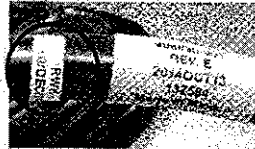
Рис. 2. Правильно собранный кабель питания (изготовлен в указанный промежуток времени, но имеет маркировку RWK)