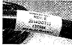
Рис. 1. Неправильно собранный кабель питания (изготовлен в указанный промежуток времени)