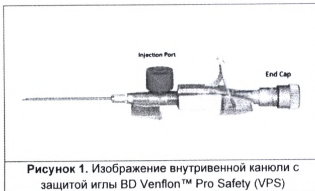
Рисунок 1. Изображение внутривенной канюли с защитой иглы BD Venflon™ Pro Safety (VPS)

Производитель подтвердил увеличение количества сообщений об утечке из инъекционного порта медицинских изделий «Катетер стерильный одноразовый периферический внутривенный с инъекционным портом и защитой иглы BD Venflon™ Pro Safety» (далее – «Медицинские изделия») (Рисунок 1) до 2.5 жалоб на 1 миллион проданных устройств при стерилизации окисью этилена (Рисунок 2). Данная проблема наблюдается, в первую очередь, в устройствах с размерами 14–18G, и реже встречается в устройствах с другими размерами.