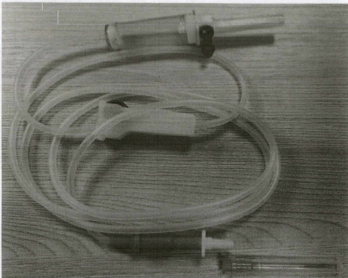
Система инфузионная стерильная для однократного применения с иглами