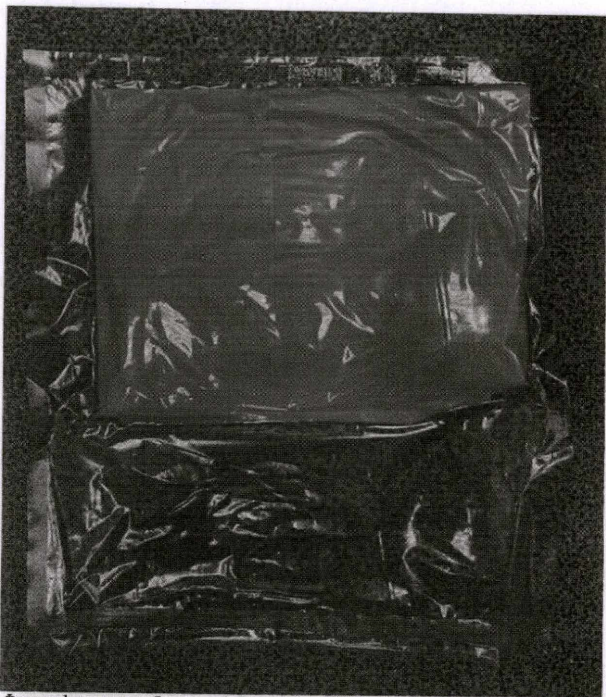
Фотографическое изображение 2. Внешний вид потребительской упаковки образцов (сторона 2)