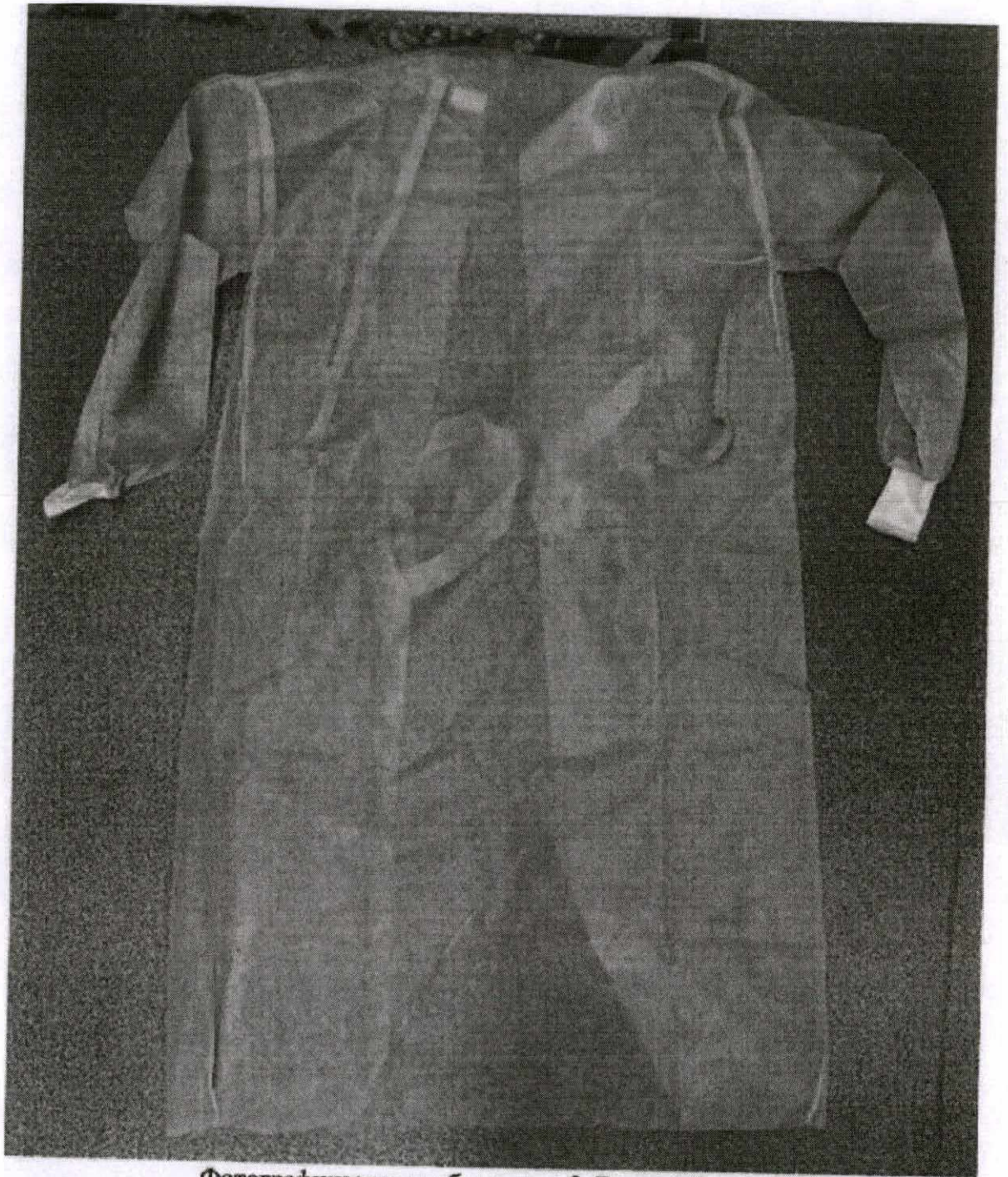
Фотографическое изображение 5. Внешний вид образцов