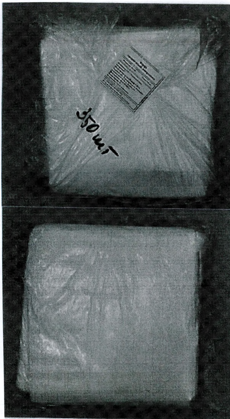
Фотографии 2-3 – Внешний вид образцов в упаковке