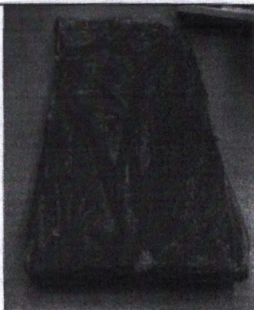
Изображение 1 – образец в пленке