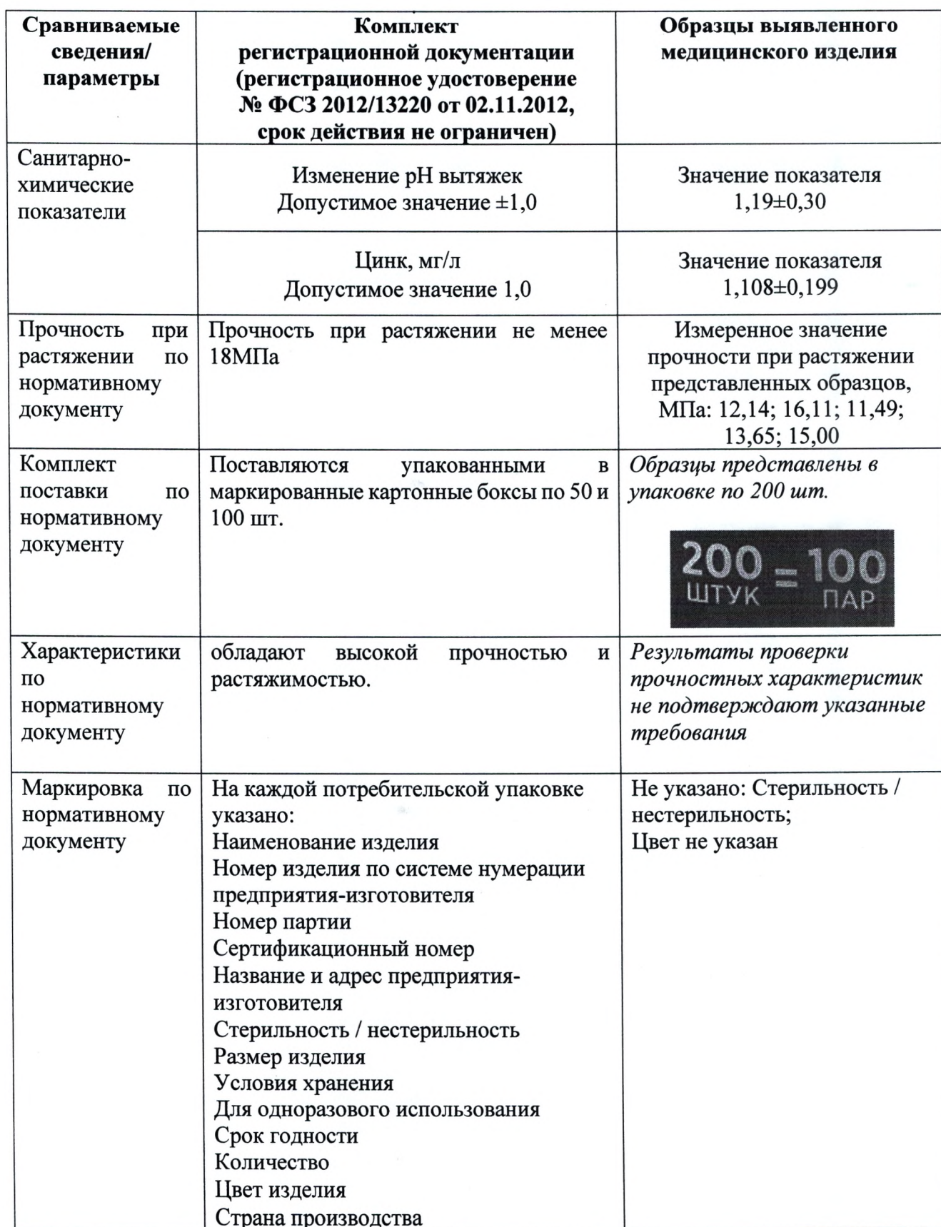
Таблица сопоставления параметров и характеристик, указанных в комплекте регистрационной документации, с параметрами и характеристиками образцов выявленного медицинского изделия